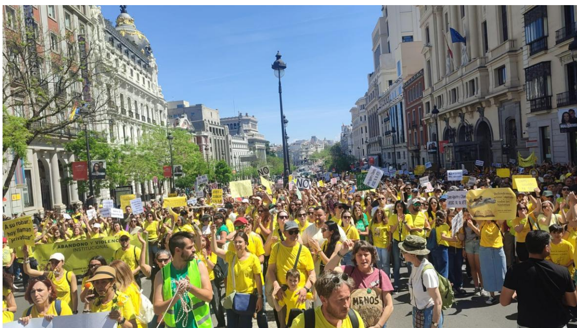
Imagen de la manifestación Salvemos la Educación Pública en Madrid el 19 de abril.