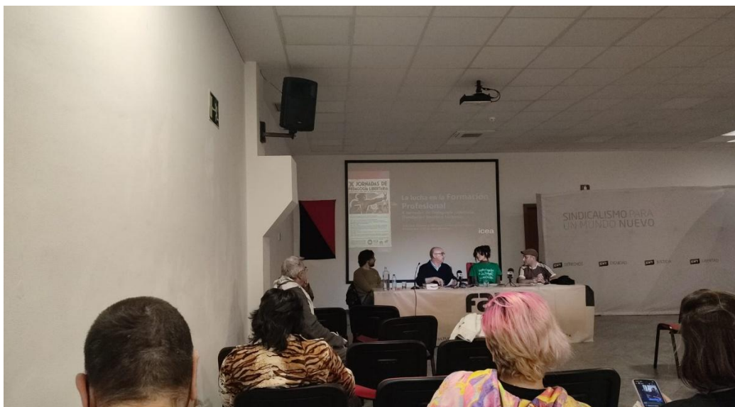
Imagen de las X Jornadas de Pedagogía Libertaria, organizadas por CNT, CGT y Solidaridad Obrera el 9 de mayo en la Fundación Anselmo Lorenzo. ¡¡Todo un éxito hecho de debate, cooperación y creatividad!!