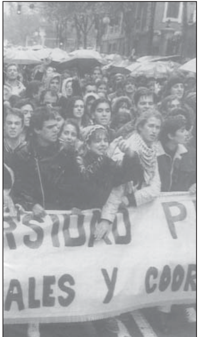
Sólo con la lucha organizada se hace frente a los planes de la Empresa