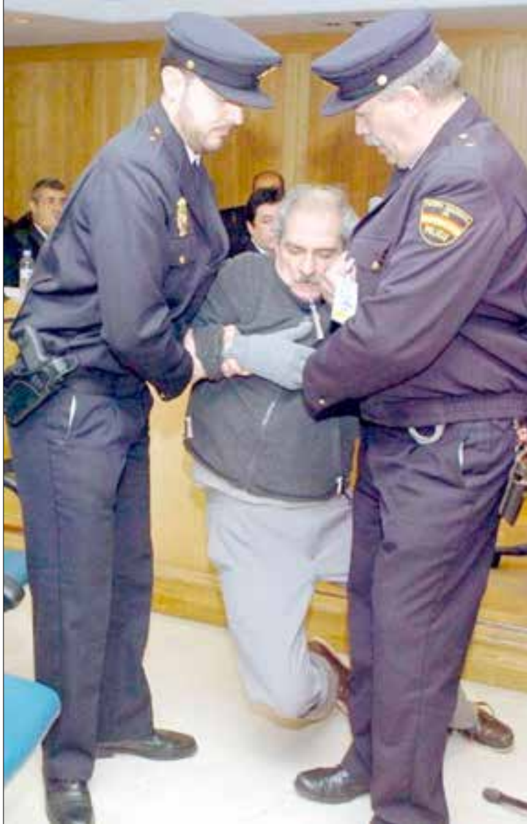
Patética actuación de Scilingo durante el juicio

de Instrucción número 5. La acción de la UPF ha sido impulsada por el interés de que no queden impunes las acciones de las juntas militares que ocuparon por la fuerza el Gobierno de Argentina desde hasta 1983 y la falta de explicaciones sobre las 30.000 personas desaparecidas, la interposición de la denuncia paraliza la prescripción de los delitos, en tanto y cuanto las leyes de obediencia debida y punto final imposibilitaban medidas