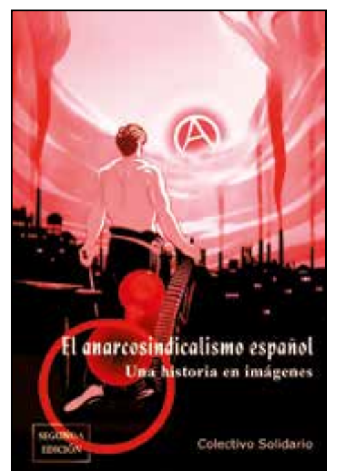
Las cubiertas de la primera y la segunda edición de éste libro