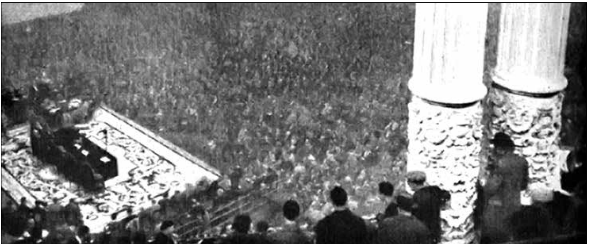
Revolución española. Asamblea de miembros de Consejos de Empresas Colectivizadas y Comités de Control Obrero 1937. Jornadas de la Nueva Economía. Palacio Nacional de Cataluña en Montjuïc