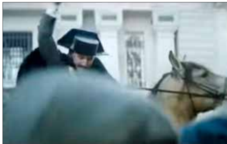
Fotograma de la película

El no tratar la historia con escrupulosa exactitud, permite escamotear el fondo del asunto, pues lo que provocan la patronal y las instituciones del Estado con la matanza de obreros es la respuesta de éstos en la forma de Grupos de Defensa Confederal (en la película se les denomina grupos de acción , y no vamos a entrar en ese asunto). Es el ellos o nosotros , y aunque en el anarquismo español ha habido eminentísimos anarquistas tolstoyanos (Recordemos de pasada a El ángel rojo ), no ha sido ni mucho menos la tendencia predominante, de modo que de eso de dejarse masacrar, nada de nada.