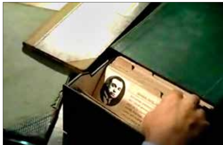
La ficha de Salvador Seguí en El Fichero Lasarte Fotograma de La verdad sobre el caso Savolta

Pero es que al final todo se sabe, aunque ya nada importe (?). En 1931 se proclama la segunda República Española, y un grupo de cenetistas, cuya organización había sido prohibida por la dictadura, toman