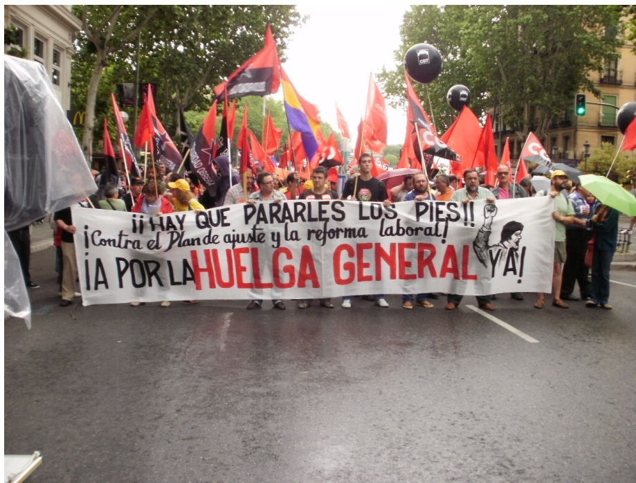
Hay que pararles los pies

En nuestro sector el número de despidos sería de entre 700 y 800 trabajadores, de los cuales un gran número podrían ser de nuestros distritos Carabanchel - Latina, puesto que son los que más trabajadores tienen.