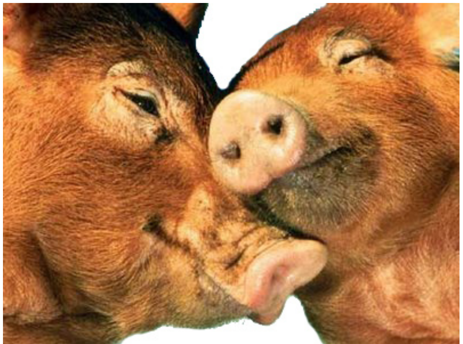
Reuniones entre CCOO y la Empresa

En cuanto a jugar con el pan de los trabajadores, aquí los únicos que juegan son los jefes que nos “roban” dinero de las nominas en cuanto tienen la oportunidad, pero de esto no se quejan públicamente estos individuos de CCOO porque la empresa “les cerraría el grifo”, solo se dedican a vocear cuando no están delante haciendo creer al personal que son “fieras salvajes”, cuando delante de los jefes son “gatitos mansos”, bueno y su misión más importante (enviados y “subvencionados” por la empresa) es la de hacer campaña contra nosotros, que es lo único que han hecho durante los dos últimos años, además de jugar con vuestro pan (aquí entran también UGT y USO). Como sabéis, a excepción de los que no quieren ver la realidad, en junio de 2008 estos individuos firmaron el precio de las horas extras por debajo del mínimo permitido por la ley y