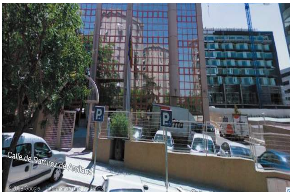
Inspección de Trabajo

Después de nosotros estaban citados los compañeros de CGT también con la empresa, y estos nos permitieron quedarnos en la sala para su careo. Ellos habían denunciado la realización de horas extras y un claro incumplimiento de convenio, que se trata de que los trabajadores sin categoría de conductor no pueden conducir vehículos de más de 3.500 kilos a