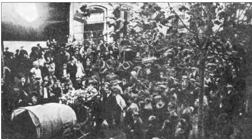
El entierro de Lorenzo

https://www.diagonalperiodico.net/saberes/24852-trayectoria-por-ideal-centenario-la-muerte-anselmo-lorenzo.html