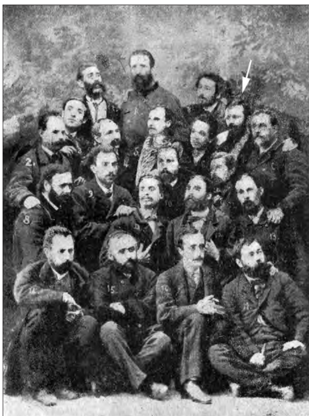
El núcleo fundador de la Internacional con Fanelli Señalizado Lorenzo

El regreso de Anselmo Lorenzo a España coincide casi en fechas con la llegada de Paul Lafargue. El yerno de Marx había huido de Francia perseguido