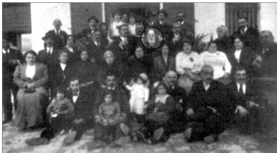
1913. Familiares y amigos de la Logia Libertad

Pero de esta época hay que destacar la labor intelectual de Anselmo Lorenzo. Vinculado a la masonería desde 1883, Anselmo Lorenzo publica desde ese momento numerosos artículos y folletos para la extensión de los ideales anarquistas. Pero la dura represión que sufre el anarquismo en aquellos momentos no fue ajena al propio Anselmo Lorenzo. En 1881 los anarquistas habían levantado una nueva asociación, la Federación de Trabajadores de la Región Española (FTRE). El número de sus afiliados es alto y, en un importante momento de desarrollo sindical, la fuerza de la FTRE comienza a ser un problema para las autoridades de la Restauración. Los "sucesos" de la Mano Negra sirvieron como excusa para la persecución contra la FTRE, así como los sucesos de Jerez de 1892. La FTRE se disolvió y sumió al anarquismo en una profunda crisis de la que no saldrá hasta el siglo XX. Es el llamado periodo de la bombas, donde como dice el historiador Juan Pablo Calero, se tiraron más periódicos que bombas. A pesar de ello y de que