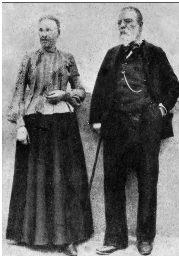
La pareja, ya en su ancianidad

Pero la salud de Anselmo Lorenzo poco le permitía hacer ya. Siguió escribiendo y dando aportaciones teóricas al anarquismo. Y cuando Europa comenzaba una guerra fratricida, Anselmo Lorenzo dejaba de existir el 30 de noviembre de 1914. Su entierro en cementerio de Montjuich se convirtió en una gran manifestación obrera, donde todas las tendencias del obrerismo rindieron un sentido homenaje a una de las personalidades más influyentes para el desarrollo de los derechos de los trabajadores.