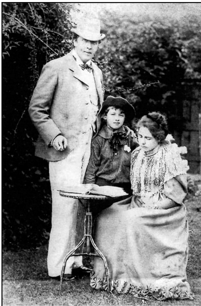
Oscar Wilde con su esposa Constance y su hijo Cyril.

siguientes seis años los pasó en Londres, París y en los Estados Unidos, a donde viajó para impartir conferencias.