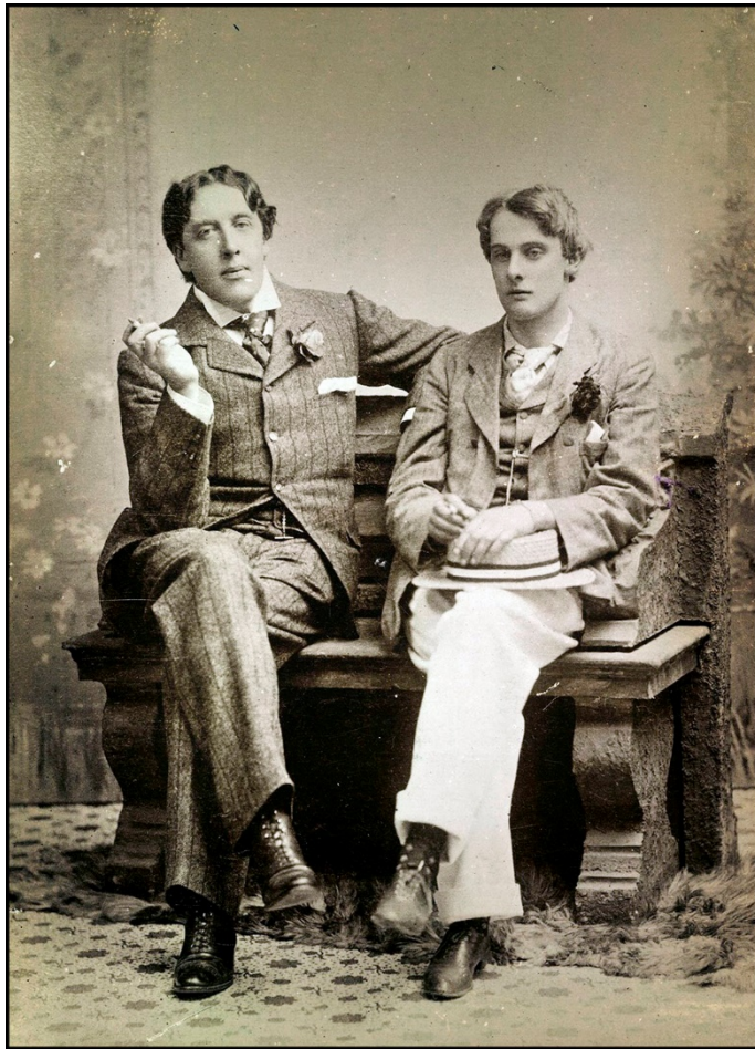
Oscar Wilde y lord Alfred Douglas

Finalmente, el noveno marqués de Queensberry quedó libre y Wilde se enfrentó a un segundo juicio en mayo de 1895, en el que se le acusó «de sodomía y de grave indecencia», y por el que fue condenado a dos años de trabajos forzados. Era la máxima sentencia para el delito de «flagrante indecencia», pero para el juez, un castigo «totalmente inadecuado» dada la gravedad de su «crimen». El fallo –que buscaba ser ejemplarizador– tuvo mucha repercusión y propició un recrudecimiento de la intolerancia sexual no solo en Gran Bretaña, sino también en Europa.