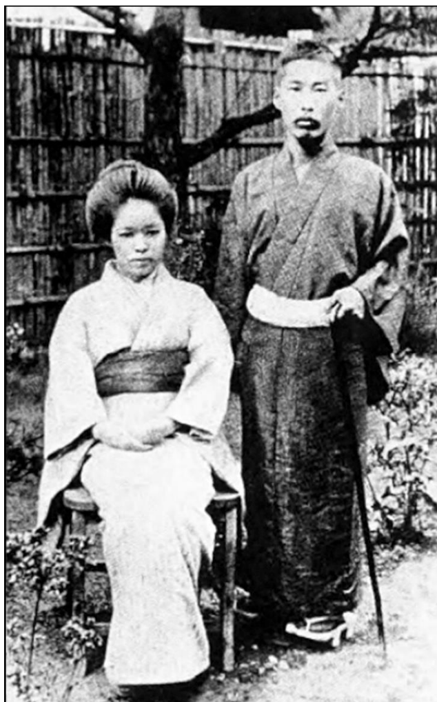
Kōtoku con su pareja Sugako Kanno

las cuales alcanzaron proporciones insurreccionales. El caso más famoso de este periodo de una huelga que llegó a la violencia contra la empresa y a la confrontación armada con el ejército fue el conflicto de la mina de cobre de Ashio en febrero de 1907.