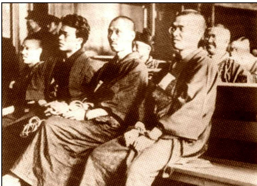
Miembros de Girochin-Sha durante un juicio en 1925

general al mando de las tropas que habían asesinado a Ôsugi. En el primer atentado, uno de los antiguos camaradas de Ôsugi, Wada Kyûtarô, disparó contra el general Fukuda pero sólo consiguió herirlo, mientras que en el segundo bombardearon la casa de Fukuda, aunque éste no se encontraba en ese momento en su domicilio. Wada fue juzgado y condenado a cadena perpetua, pero se suicidó estando en prisión en 1928.