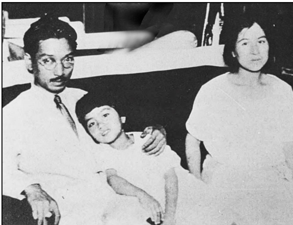
Sakae Ōsugi y Noe Ito con su hija Mako

ni un solo atentado contra ningún objetivo. Lo máximo que se había conseguido era la detonación con éxito de una bomba de prueba en las montañas. Sin embargo, era la oportunidad que las autoridades esperaban desde el folleto «Terrorismo» de 1907. Se detuvo a cientos de sospechosos y se fabricó un caso en el que 26 de ellos habían participado en un complot para asesinar al Emperador 17 .