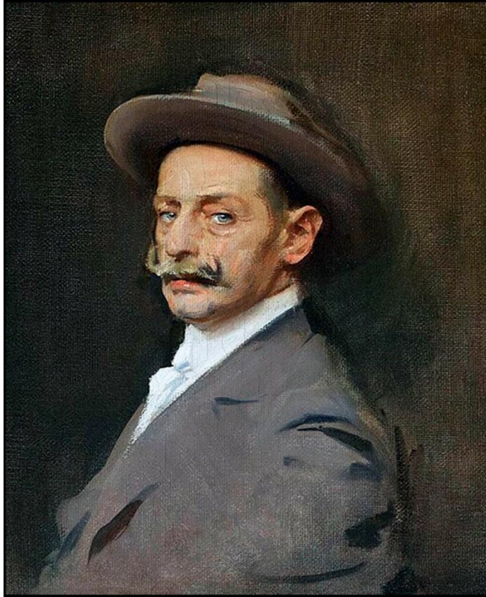
Joaquín Dicenta retratado por Ramón Casas