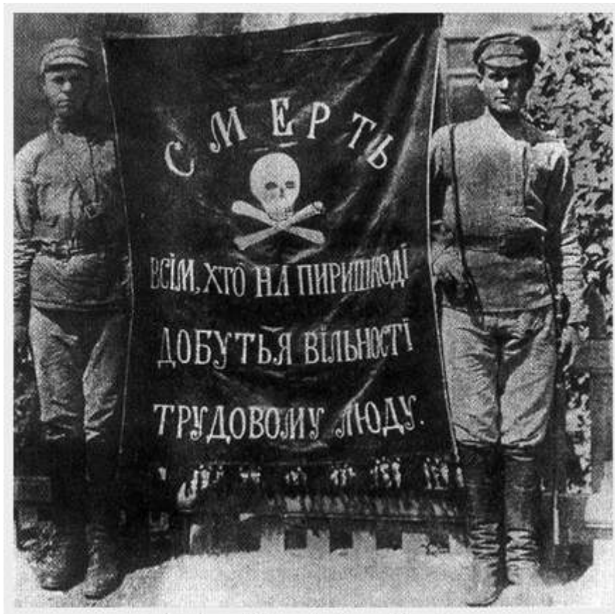
La bandera de la revolución makhnovista