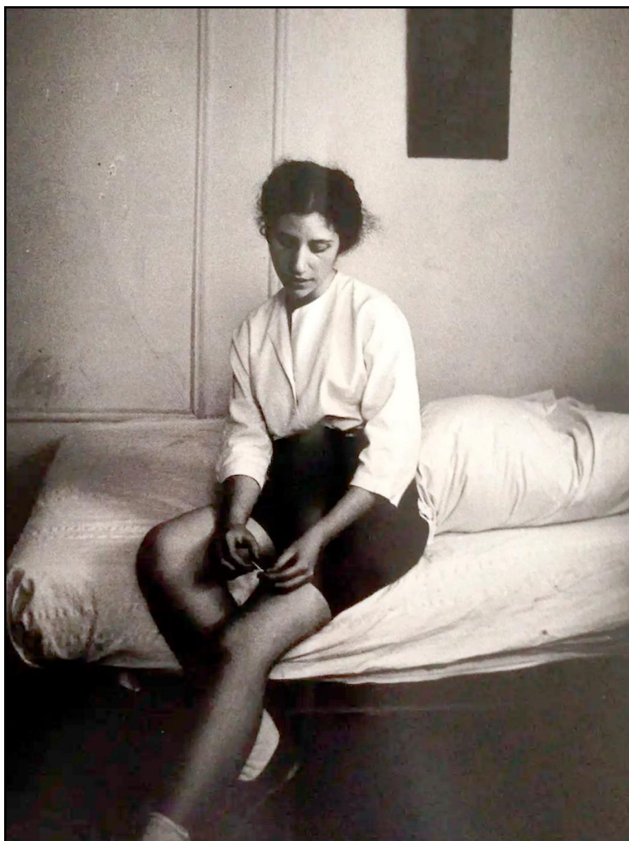
Diane di Prima