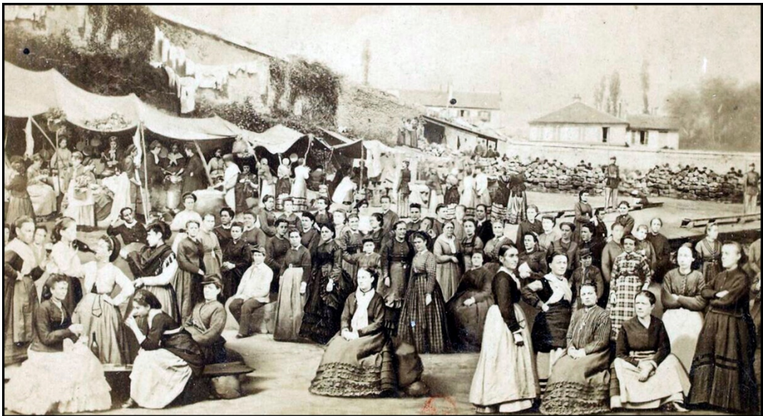
Communardes à la prison des Chantiers, à Versailles, 1871-1873