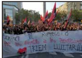
Defensant els drets i les llibertats de la classe treballadora a la vaga general del 3 d'octubre.