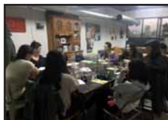
Companyes de la Soli a l'Espai Autònom de Reunió i Participació Femenina del passat 13 d'octubre de 2018.