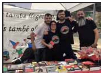
Parada de llibres per Sant Jordi '18, a Santa Coloma de Gramenet.