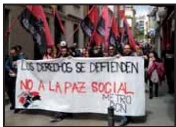
Manifestació del 1er de Maig, a Badalona.