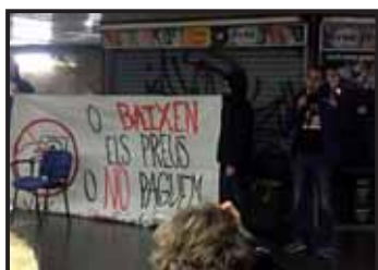
Un company de la Soli intervenint a l'assemblea de STOP PUJADES a l'estació de Vallcarca.