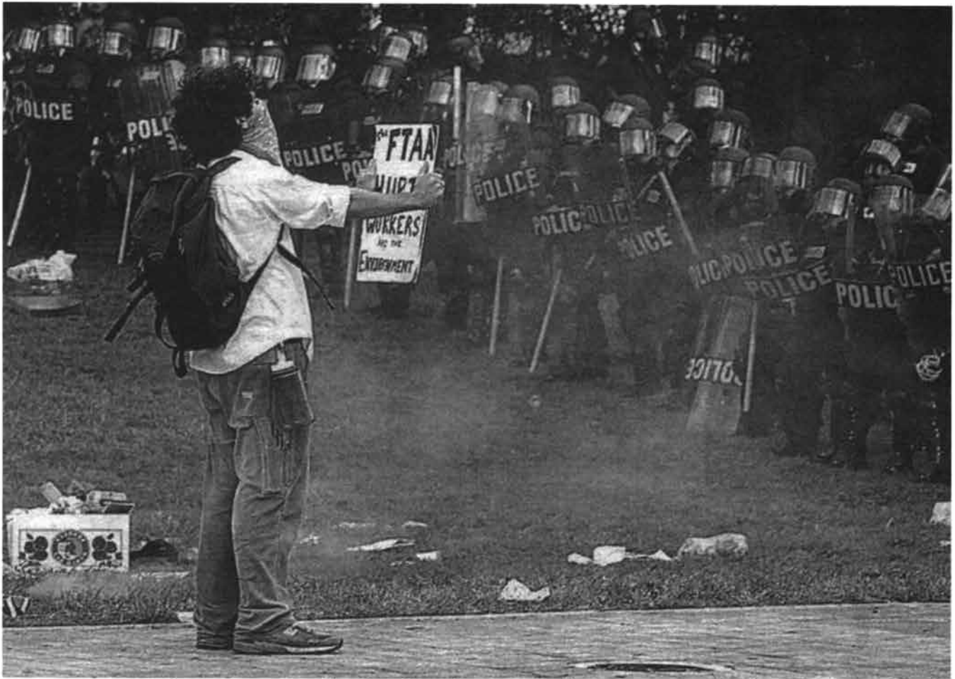
La lucha contra la globalización es la lucha contra el capitalismo