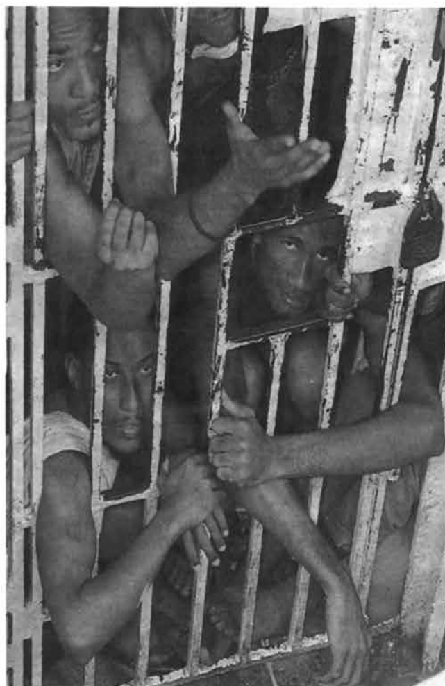
...las cárceles son similares en todas partes

la necesidad de gobierno, del estado, de apoderarse del derecho exclusivo a castigar, o sea, del uso exclusivo de la violencia sobre las personas libres; la utilidad funcional de este hecho es la necesidad de hacer valer sus leyes por medio del terror y la tortura, a fin de destruir a los enemigos del sistema vigente y aquellas personas insumisas a sus códigos y leyes. Pero también tienen sin duda un origen social: el control por parte del poder de los y las desheredadas y pobres, de la inmensa masa de pobreza y marginación que se mueve dentro de las sociedades modernas, a fin de frenar, en gran parte, el descontento social, reprimiendo constantemente las capas sociales más contestatarias. Por todo ello, podemos ya concluir que la prisión, las cárceles modernas, son una herramienta del aparato gobernante, mediante el cual afianzan su poder; que éstas surgen de la necesidad del poder de controlar al pueblo, de la necesidad de regularlo, de ordenarlo, de