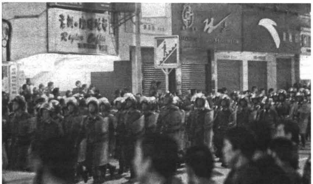
La represión en China, el ejército contra el enemigo interior

Comité de Solidaridad de los Trabajadores