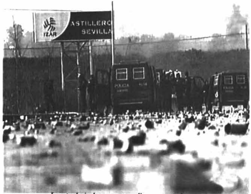
Los trabajadores respondieron en todas partes..

Asturias no puede continuar con este tipo de medidas políticas liberalizadoras que ponen en peligro nuestra industria y nuestro empleo.