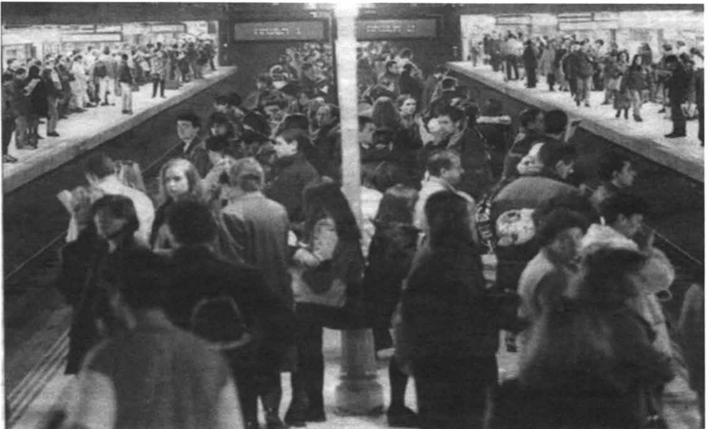
Nueve de cada diez tienen contrato precario

Hoy todo se mueve por intereses económicos y cuando hizo falta mano de obra barata en Europa, la secuestró de los países pobres, como hoy sigue secuestrando sus riquezas naturales. Hoy miles de trabajadores se mueren en el intento de saltar al primer mundo (paraíso consumista que ven a través de la televisión) a los pies de sus murallas y solo reciben hipócritas migajas que sirven de publicidad para campañas humanitarias o electorales. ¡¡DINERO!!; hoy sacan beneficio hasta de la miseria ajena pues se puede ser " solidario " sin dejar de mirar la televisión, con una llamada telefónica, a través del banco, internet o con un mensaje desde el móvil. Esa solidaridad tan parecida a la limosna, a la caridad cristiana, que no sirve más que para prolongar la agonía y lavar la cara de los que todo