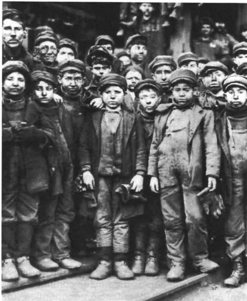
...al capital solo le importan los beneficios