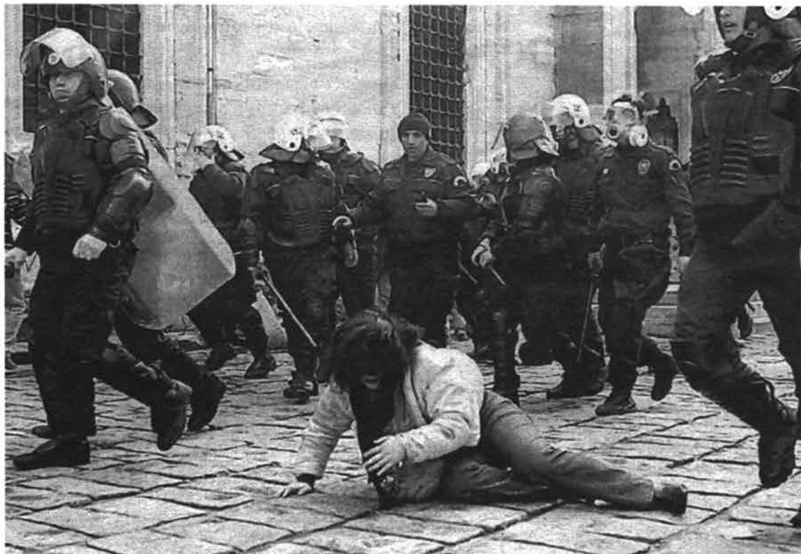
...el «éxito» en el sistema pasa por pisar a los demás

-Precariedad en los derechos sociales , la sanidad sobre saturada, la enseñanza peor que hace treinta años, la vivienda como objeto de lujo y de enriquecimiento de unos pocos, etc.