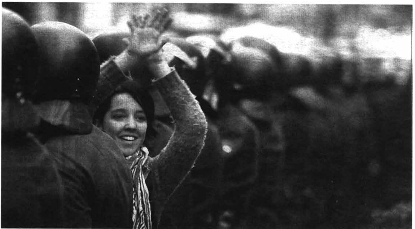
Las fuerzas de seguridad siempre defienden el «orden» establecido

La cárcel no evita la reincidencia, sino que crea una masa de población que la frecuenta regularmente el resto de su vida. Los presos son sometidos a los más duros regímenes de vida que los destruyen física y mentalmente. Padecen actos de violencia arbitraria, de abuso de autoridad, soledad extrema, aislamiento absoluto, ausencia de intimidad y dignidad; encerrados bajo condiciones infrahumanas en auténticas mazmorras. Así mismo vienen soportando diariamente cacheos con desnudos integrales, humillaciones, hacinamiento, palizas, dispersión y la falta de asistencia médica y jurídica; lo que lleva a muchos a la drogodependencia inducida