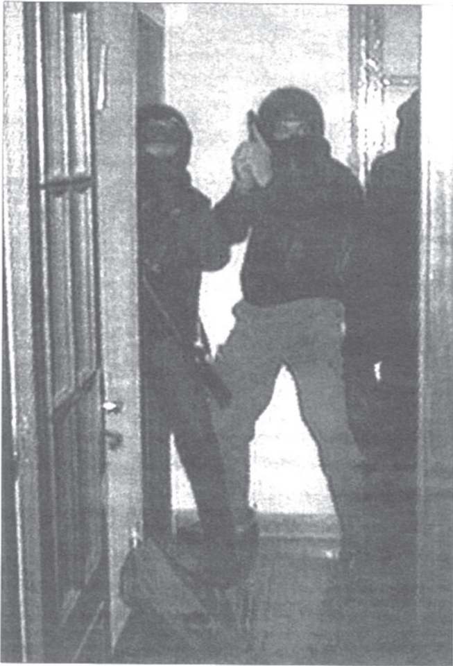
La tecnología y su posesión crea desigualdad

que se haga de ella, el que la posee domina y somete al medio natural, explota los materiales y obtiene beneficios y, por último, controla las necesidades y deseos humanos. Es más, la teoría darwinista de la evolución aplicada al ámbito social, ha llevado a defender, a los abanderados de la tecnología, que el progreso tecnológico es bueno, ya que, según la selección natural, solo sobreviven los más aptos, los mejores, los más fuertes, y la tecnología lo ha hecho. Y esto es otra de las características de la tecnología: su ansia de vencer, de hecho, la mayoría de los adelantos tecnológicos aplicados a la vida social, han sido primero utilizados en el ámbito militar, desde las aleaciones de metales a Internet.