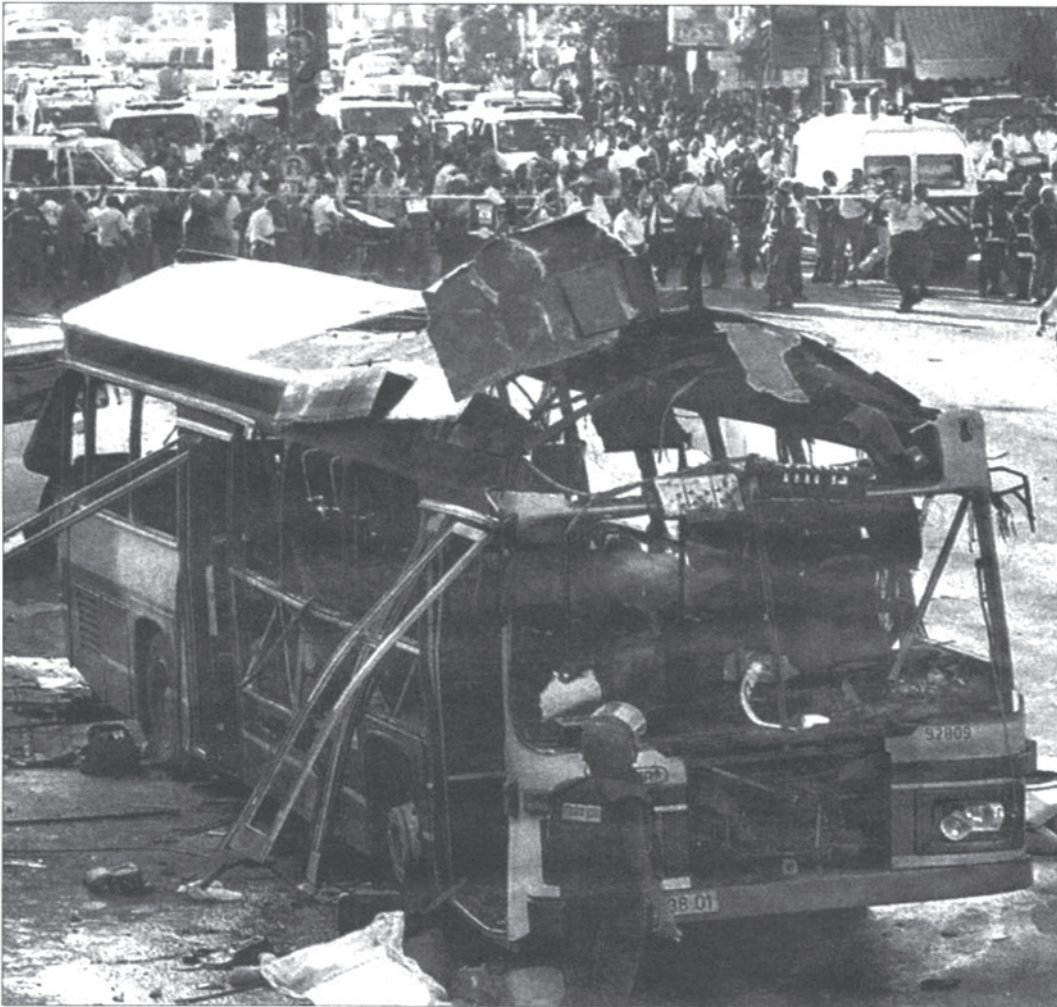
La represión sionista tiene respuesta en los atentados suicidas.

queremos utilizarlos yo y mi familia se les tiene que pedir permiso, como si ellos fueran los dueños. Naturalmente, intento hacer valer mis derechos y por fin el tribunal dicta sentencia, ordenando el abandono, aunque sólo de las últimas estancias ocupadas. Pero no solo no hacen caso, sino que vuelven a agredirnos y ante todo esto la autoridad no hace nada para que se cumpla la sentencia, ni para evitar las continuas agresiones. Aprovechando nuestra indefensión, pues ellos tienen armas y nosotros nada, continúan ocupando más habitaciones, de forma que nos vemos obligados a defendernos más arriesgada y contundentemente, pero ellos matan a mis hijos y todo sigue igual, nadie les castiga por ello. Esta es mi historia. ¿si fuera la tuya qué harías?