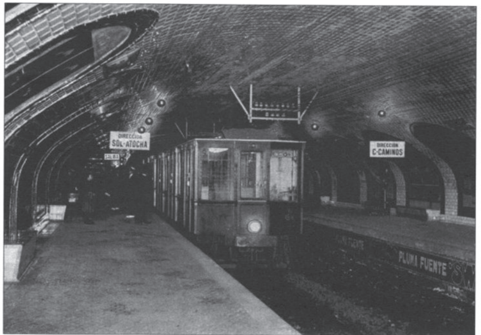
La tecnología no surge por casualidad, su objetivo la dominación

Todo lo anterior nos lleva a pensar que la tecnología no surge por casualidad, sino que ya en sus inicios tiene un objetivo: la dominación. Sea cual sea el uso