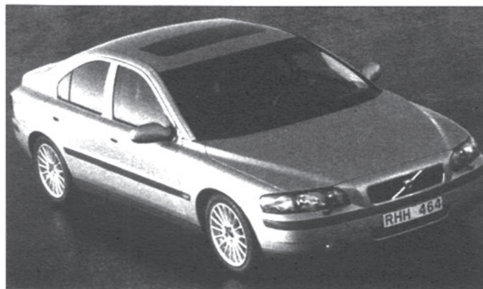
...el coche, ordenador, o televisión, crea hábito...

Resumiendo, el punto de vista expuesto en este artículo: Utilizar la técnica supone dos cosas: por un