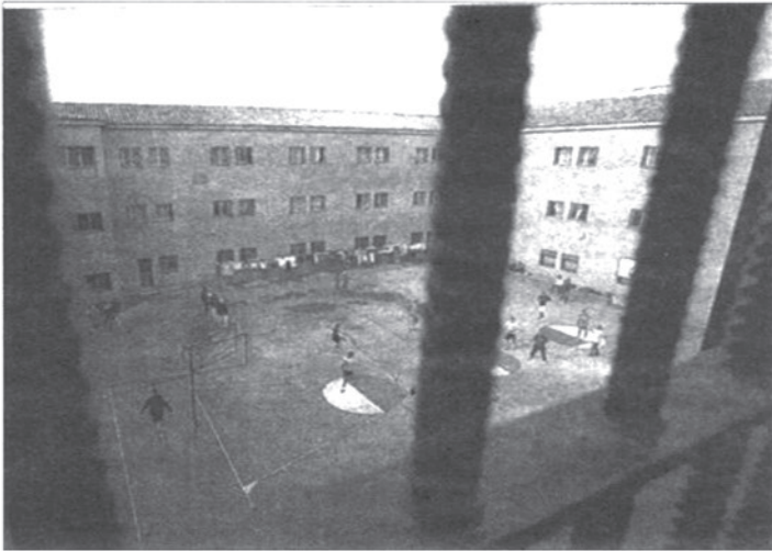
La cárcel da lugar a un mayor cúmulo de injusticias

desigualdad y la avaricia, o sigamos gobernados y gobernadas por políticas corruptas al servicio de otros intereses que no son lo de la comunidad.