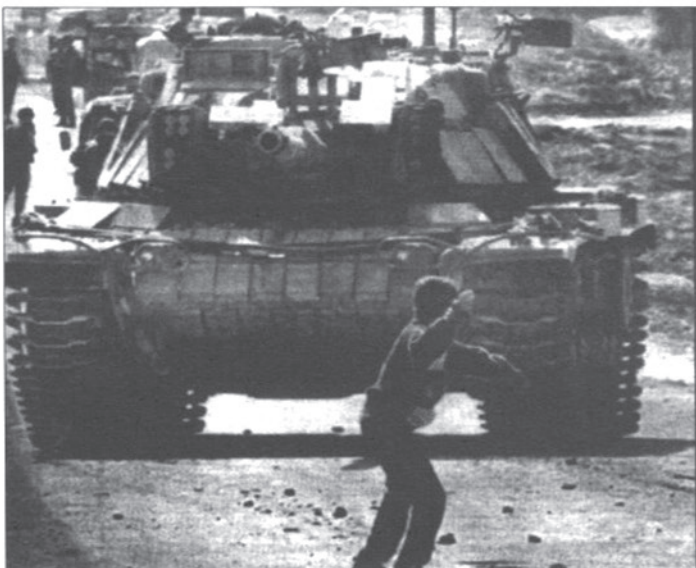
La defensa es desigual hasta lo inimaginable

Pasa el tiempo y los nuevos ocupantes ya utilizan la cocina, el servicio, el cuarto trastero y además, si