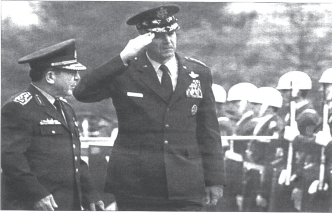
Jefe del Estado Mayor USA, Richard Myers, pasando revista a tropas turcas.